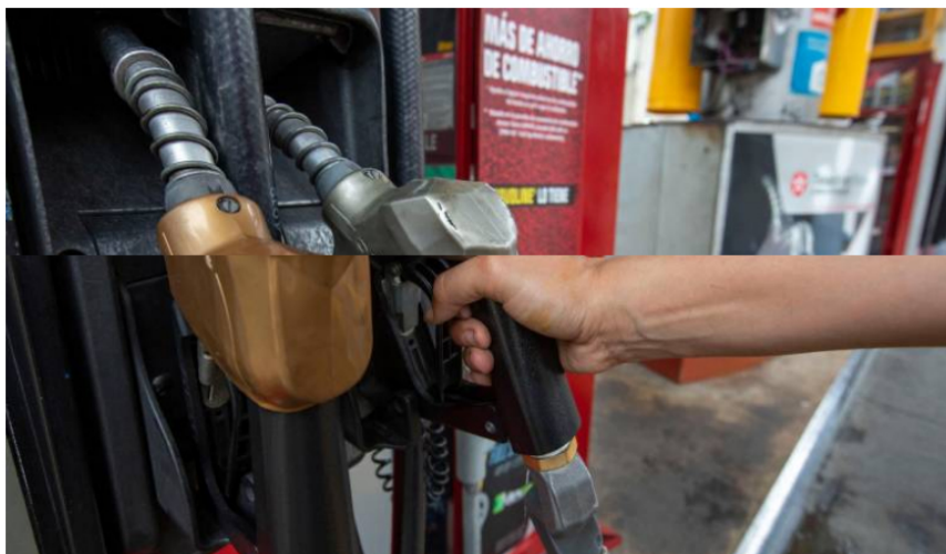
Con corte a septiembre, el galón de corriente en Colombia ha subido $4.480.

El ingreso al productor pesa cerca de un 50% en el precio final.