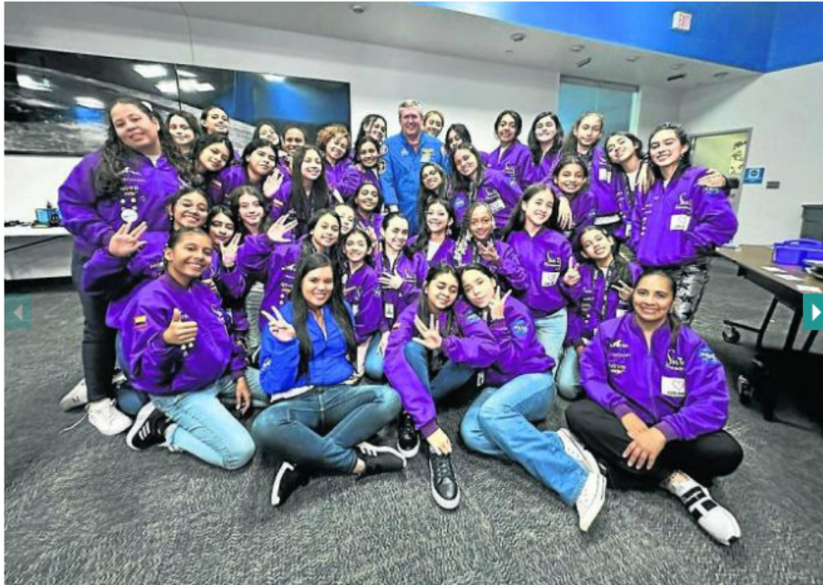
35 niñas de 23 departamentos del país tuvieron el privilegio de viajar al Space Center de la Nasa y compartir junto a expertos de la Nasa las experiencias durante las misiones espaciales.

Luego de cumplir exitosamente su primera misión como 'astronautas', una estudiante de Puerto Wilches y otra de Barrancabermeja retornan este domingo a sus hogares.