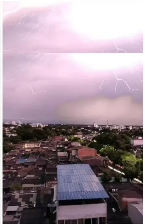
Vendaval afectó infraestructura de Ecopetrol en Barrancabermeja, Santander