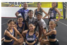
Barrancabermeja abre las puertas al Campeonato Nacional de Porrismo

Son casi 70 trabajadores que estarían afectados y quienes están pidiendo al Ministerio de Trabajo que intervenga para que se instalen mesas de trabajo con la empresa Aguas de Barrancabermeja, la Alcaldía, Ecopetrol y el consorcio encargado del proyecto.