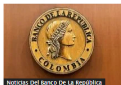
Noticias Del Banco De La República

Ataques de Petro minan confianza y relación con empresarios de Colombia