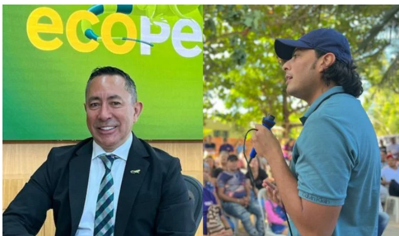
Ricardo Roa deberá responder por caso de Nicolás Petro.

La Procuraduría General de la Nación dio a conocer que Ricardo Roa, presidente de Ecopetrol , tendrá que comparecer ante la institución por el caso de Nicolás Petro.