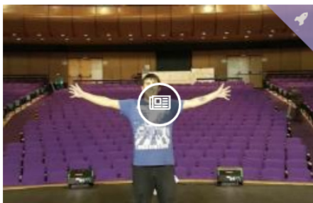
El neuquino que recorre