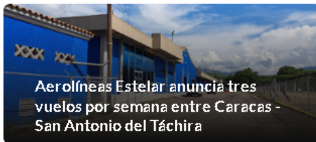
Aerolíneas Estelar anuncia tres vuelos por semana entre Caracas - San Antonio del Táchira