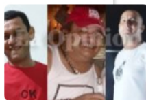
Crímenes del Eln siguen impunes en la frontera con Venezuela