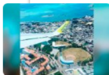
San Andrés no le quitará la gasolina subsidiada que "por ley" es de Norte de Santander