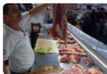
Hay posiciones encontradas por la reapertura de los mataderos municipales