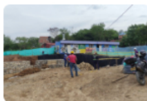
Barrio Las Delicias espera celeridad en las obras y mayor seguridad