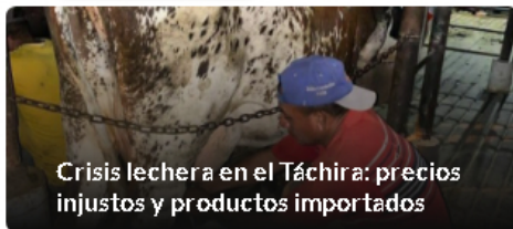
Crisis lechera en el Táchira: precios injustos y productos importados