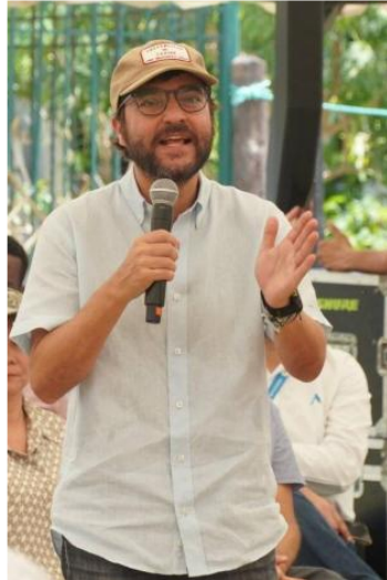
Jaime Pumarejo, alcalde de Barranquilla.