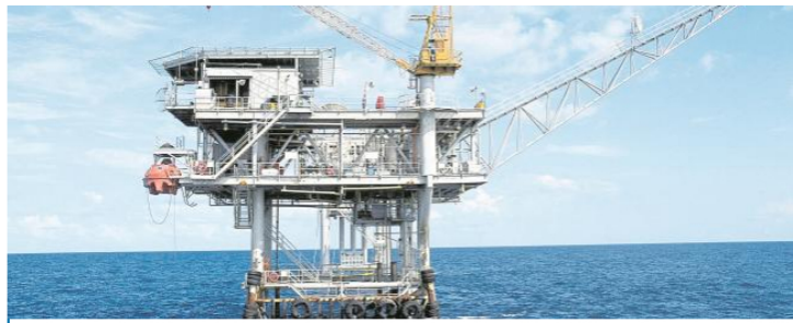
El campo de gas natural costa afuera Chuchupa, situado en La Guajira, es operado por Chevron en conjunto con la petrolera estatal Ecopetrol.