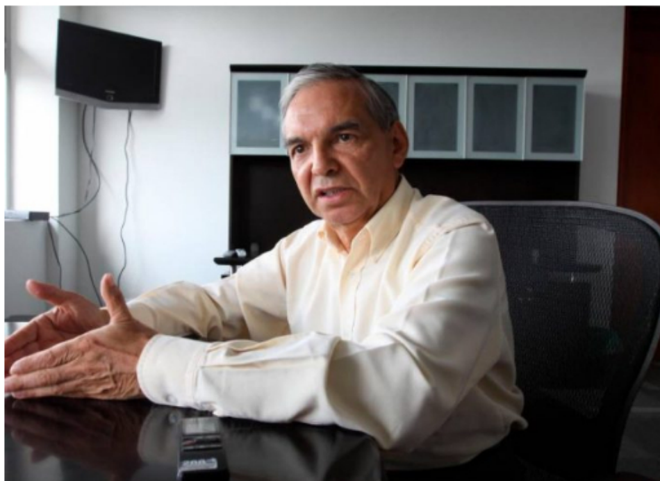
Ricardo Bonilla – Ministro de Hacienda

Después de varias jornadas de paros y manifestaciones, se llevó a cabo una reunión en la Casa de Nariño con el presidente Gustavo Petro y su gabinete, donde se acordaron revisar posibles beneficios para los taxistas. El ministro de Transporte, William Camargo, aseguró que se estudian tarifas diferenciales para este sector. «Este es un proceso que tiene que revisarse desde el punto de vista de cómo se operativiza y a través de qué mecanismo se concerta con el sector hacendario,» comentó el ministro.