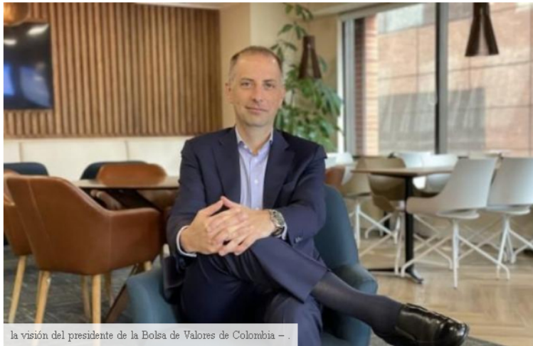
la visión del presidente de la Bolsa de Valores de Colombia – .