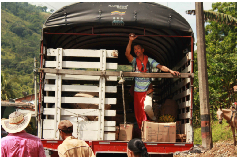
En Colombia cerca de tres millones de personas trabajan en actividades de agricultura, ganadería, caza, silvicultura y pesca.

Los logros macroeconómicos del último año son el equilibrio en la balanza de pagos, la reducción del déficit fiscal y la contención de la inflación. El empleo sigue a la baja, aun en condiciones de decrecimiento. Todo apunta a que el crecimiento del PIB será de dos puntos porcentuales