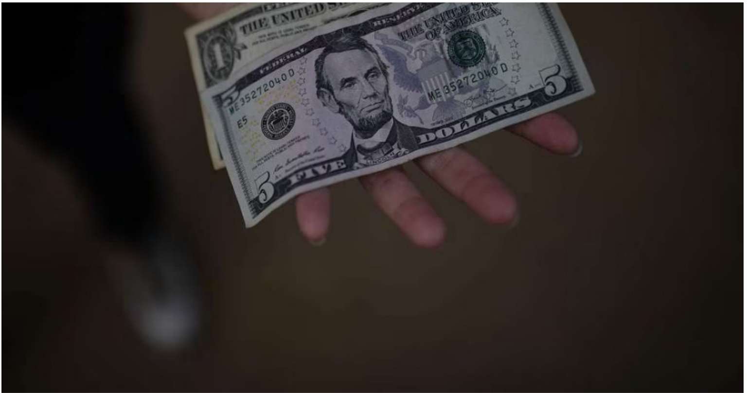
Imagen de referencia.