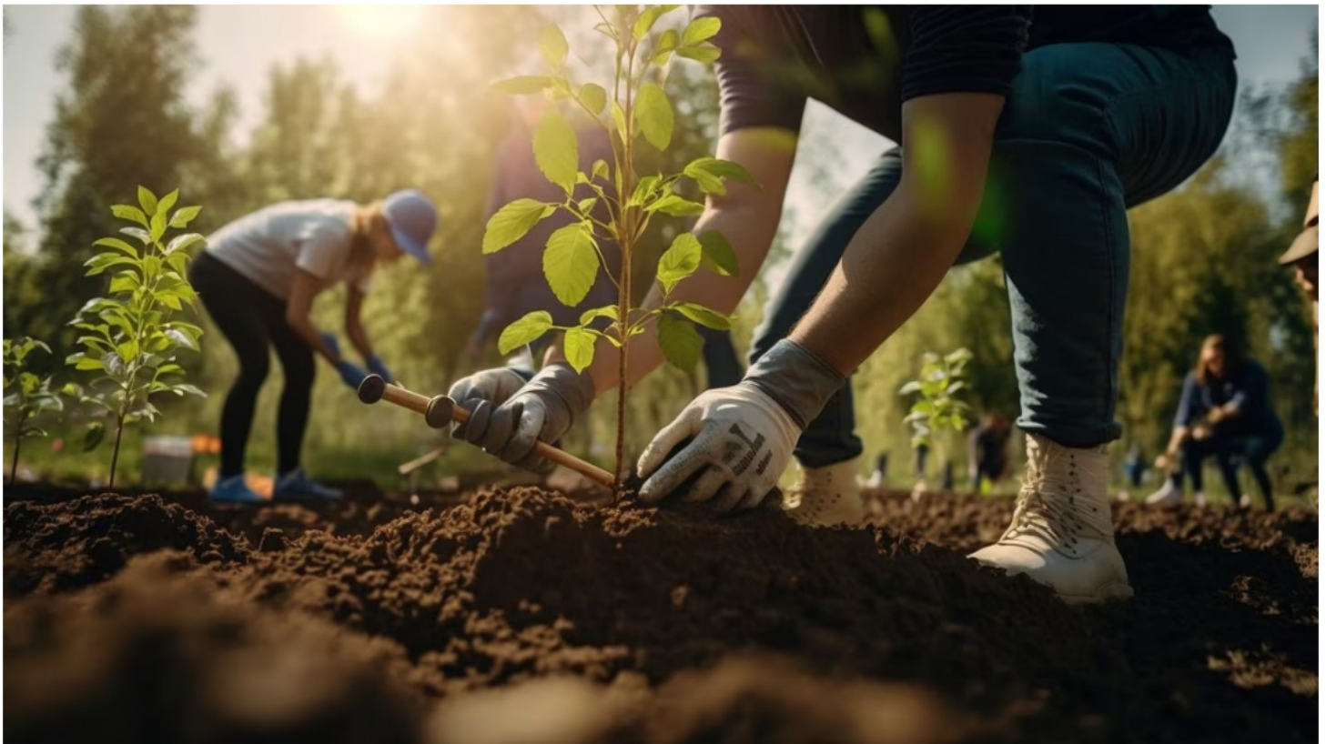
Se estima que en los bosques tropicales las tasas de erosión del suelo pueden aumentar hasta un 2.000 por ciento en zonas de deforestación.

Una de las grandes problemáticas ambientales de hoy es la deforestación. Se estima que un árbol adulto sano puede producir alrededor de 118 kilogramos de oxígeno al año y gracias a que absorbe el CO2 de la atmósfera contribuye a reducir los efectos del cambio climático. Sin embargo, cada año se pierden a causa de la deforestación aproximadamente 18 millones de hectáreas de bosque por minuto, que equivalen a 27 canchas de fútbol.