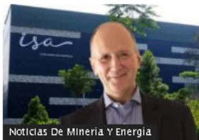
Noticias De Minería Y Energía