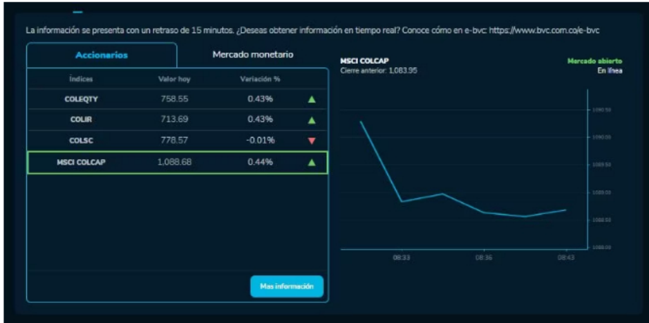
Cómo amanecieron los índices bursátiles el 27 de Octubre. MSCI COLCAP, COLSC, entre otros.

de 0,42% y un valor hoy de 758,55. Este indicador es uno de los más amplios del mercado accionario colombiano, pues agrupa cerca de 40 acciones con la mayor liquidez en el mercado.