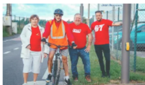
Afronta el desafío de la movilidad 26/09/2023 En «central general»