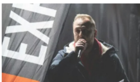
"Arrebatan tarjetas de paro de las manos de los delegados" 07/05/2023 En "Noticias"