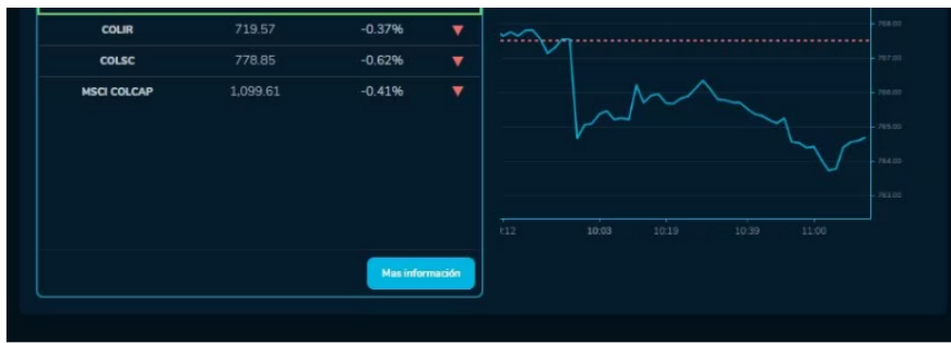
Cómo amanecieron los índices bursátiles el 26 de Octubre. MSCI COLCAP, COLSC, entre otros.