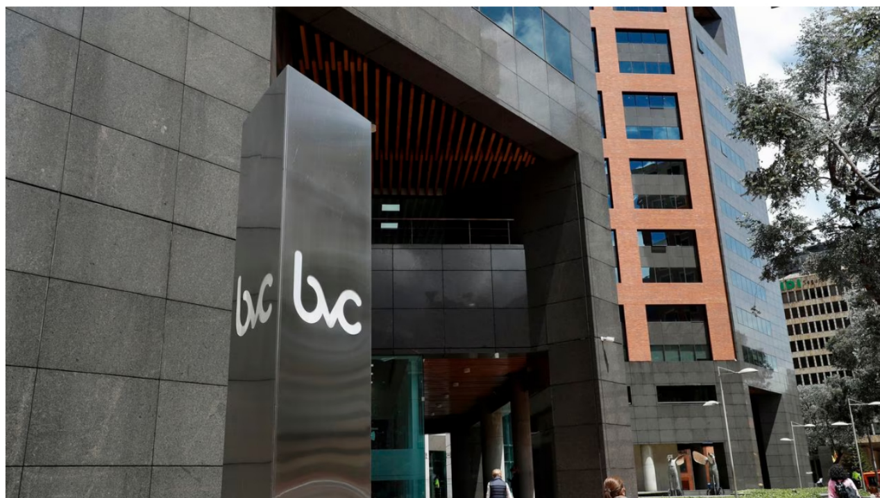
La Bolsa de Valores de Colombia amaneció en rojo este jueves.

El mercado accionario colombiano abrió este jueves con una caída pronunciada en varios de los activos que hacen parte del mercado de renta variable. Ecopetrol también registra números rojos en sus acciones, por lo que no hay buenas noticias al inicio de la jornada bursátil para quienes tienen acciones en esta compañía.