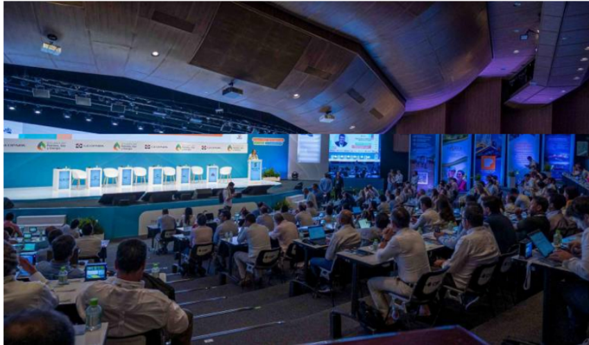
Mauricio Cárdenas propuso no desistir en la exploración y producción de hidrocarburos.

El exministro de Hacienda, Mauricio Cárdenas, aseguró que no debe descuidarse el negocio petrolero.