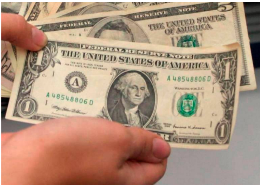
La economía estadounidense sigue mostrando fortaleza a pesar del contexto de altas tasas de interés de la Reserva Federal.