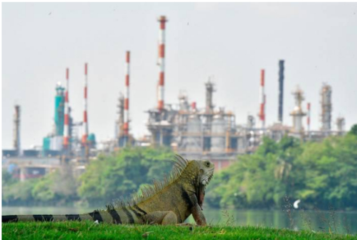
Reducción de la actividad petrolera

Ante las declaraciones de la USO, sobre la reducción de la actividad exploratoria al menos para Ecopetrol , Castañeda precisó que a noviembre del 2022 había 60 taladros de perforación y para septiembre de 2023 se redujo a 37, eso es 38 % menos de actividad.