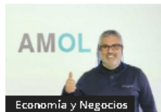
Economía y Negocios

Pymes: el crecimiento va de mano con la automatización