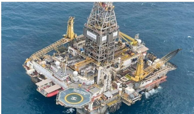
Ecopetrol buscará socios para desarrollar proyectos offshore en el Caribe.