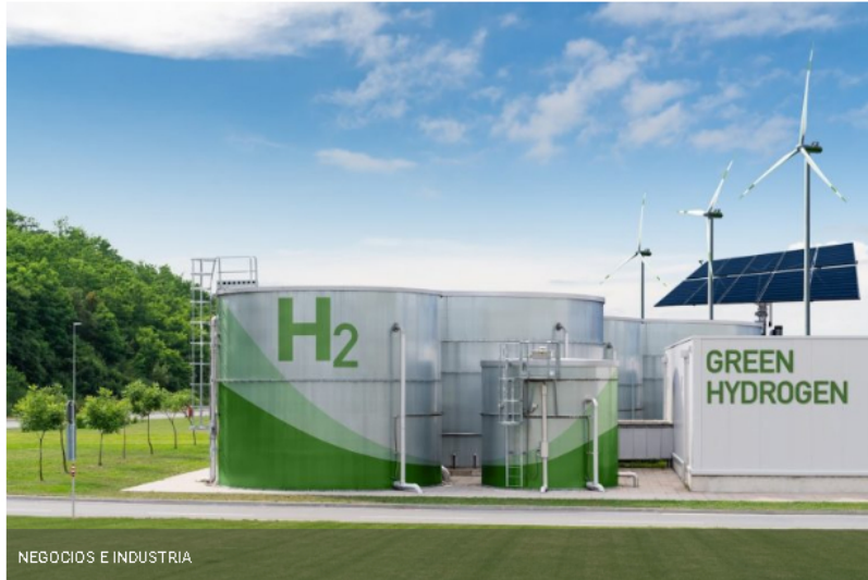
NEGOCIOS E INDUSTRIA

Este encuentro se realiza desde 2017 en Chile y se ha posicionado como el evento de acceso abierto más importante de la región para la nueva industria del hidrógeno renovable.