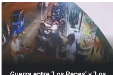
Guerra entre 'Los Penes' y 'Los