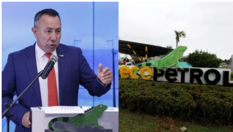
Ricardo Roa, presidente de Ecopetrol , responde a aleta de la USO sobre el recorte del presupuesto de inversión

Durante la VI Cumbre del Petróleo, Gas y Energía, el presidente de Ecopetrol Ricardo Roa se expresó sobre el futuro de la compañía y su negocio tradicional de exploración y producción de petróleo y gas natural .