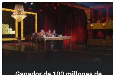
Ganador de 100 millones de