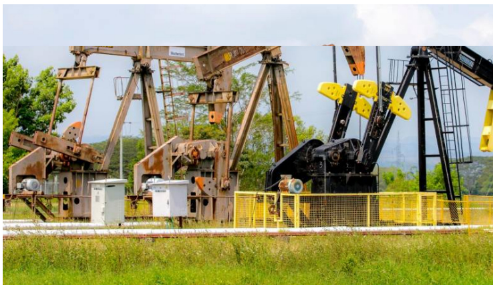
El sindicato de Ecopetrol le retira su apoyo al Gobierno de Gustavo Petro.

La central obrera se pronunció en contra de los anuncios de recortes de US$2.000 millones enfocados en estas áreas claves, aseguró.