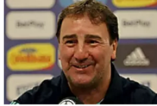
Néstor Lorenzo y su opinión de la Liga colombiana