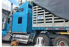
393 kilos de clorhidrato de Cocaína fueron incautados en las vías d...

El siguiente artículo se está cargando ..