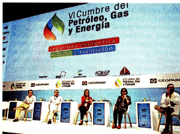
Participantes del panel “Estado, empresas y desarrollo territorial”, en Cartagena.

trol, dijo que es de tener en cuenta que la industria petrolera genera empleos bien remunerados, algo que es de importancia si se considera marchitar la industria. Apuntó que una transición energética requiere también una transformación económica en las regiones.