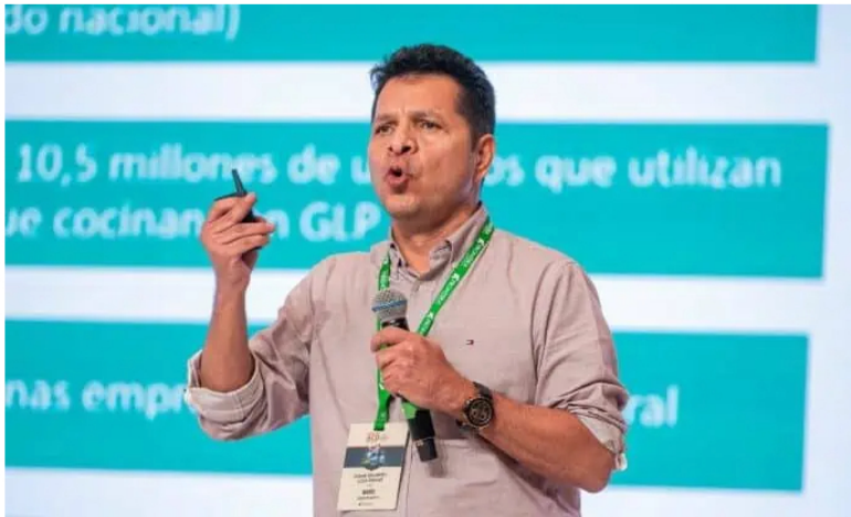
USO prende alarmas en sector petrolero por reducción en presupuesto de Ecopetrol .

Síguenos en nuestro canal de noticias de WhatsApp