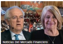
Noticias Del Mercado Financiero

Exministros de Petro se van contra reforma pensional: firman carta que pide cambios