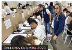
Elecciones Colombia 2023

Exministros de Petro se van contra reforma pensional: firman carta que pide cambios