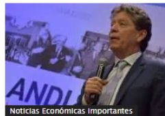
Noticias Económicas Importantes

Medidas del Gobierno de seguridad durante las regionales: podría decretarse toque de queda