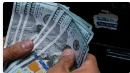
Dólar en Colombia comienza la semana cotizando en $4.200