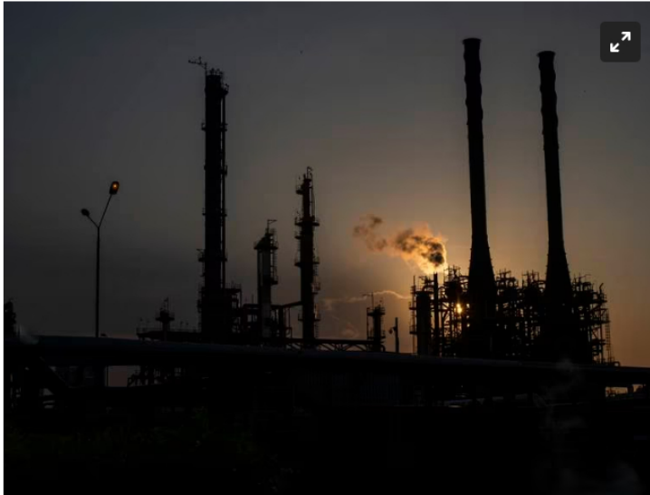
Petrolera colombiana Refinería ECOPETROL , Barrancabermeja, Santander, Colombia

La Unión Sindical Obrera emitió una alerta respecto a la supuesta crisis económica que encamina la empresa petrolera.