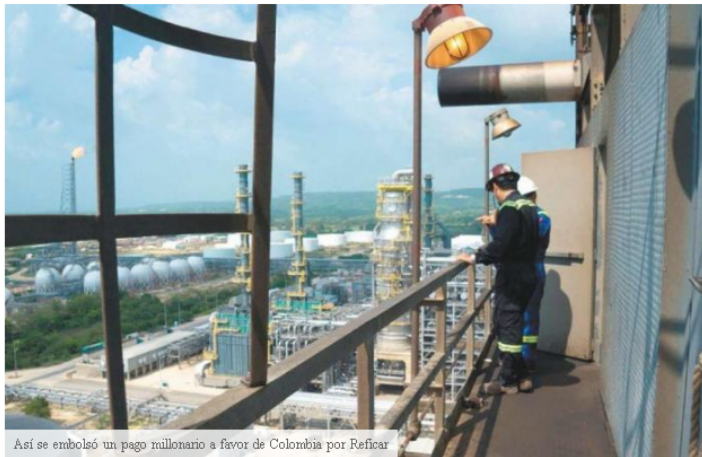
Así se embolsó un pago millonario a favor de Colombia por Reficar

Empleados hablan en un balcón de la Refinería de Cartagena SA (Reficar), filial de Ecopetrol SA , en Cartagena, Colombia, el viernes 20 de mayo de 2016. Ecopetrol dice que está importando crudo Marlim de Brasil para complementar la dieta de crudo local en Reficar. Reficar ha estado produciendo cerca de 140.000 barriles por día.