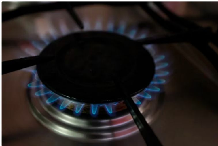
IMAGEN DE REFERENCIA: Gas, cocina de gas, llamas, llama, fuego, fogón, fogones, que funcionan con gas natural

El Gobierno de Colombia está preparando una actualización de sus proyecciones sobre el abastecimiento de gas natural en el país. Existe la posibilidad de que la necesidad de importar gas se haya postergado más allá de la fecha prevista, que era el año 2026 ; así lo reveló en exclusiva la emisora de radio colombiana Blu Radio .