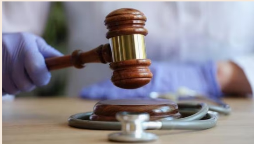
Personal médico tiene prohibido realizar celebraciones en horario laboral: estas son las sanciones.

En distintas ocasiones, pacientes han captado personal de salud en fiestas y celebraciones durante su horario laboral. Conozca las sanciones a los que están expuestos los funcionarios.