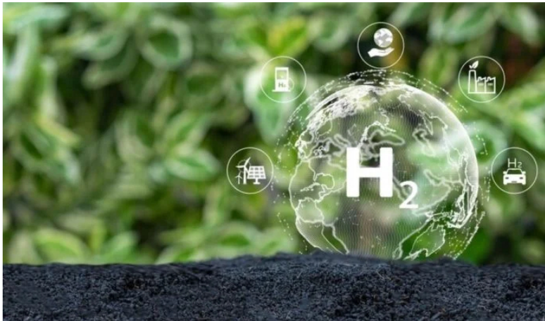
ANDI y Nатурgas lanzan Corredor de Hidrógeno en Colombia.