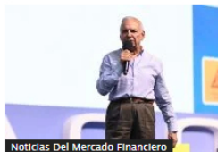
Noticias Del Mercado Financiero