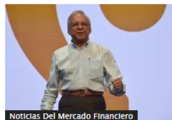
Noticias Del Mercado Financiero