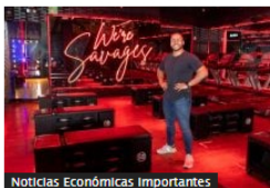
Noticias Económicas Importantes