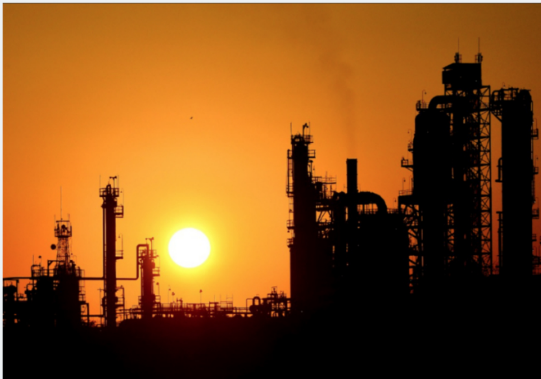
Instalaciones de gas y petróleo de Ecopetrol .

La petrolera estatal colombiana Ecopetrol ha anunciado el descubrimiento de gas natural en el pozo exploratorio Glaucus-1 , ubicado en aguas profundas del mar Caribe , a unos 75 kilómetros de la costa y a más de 130 kilómetros del municipio de Coveñas, en el departamento de Córdoba.