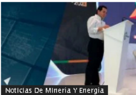
Noticias De Minería Y Energía

Carbón de Colombia es menos competitivo en el mundo por reforma tributaria: Fenalcarbón