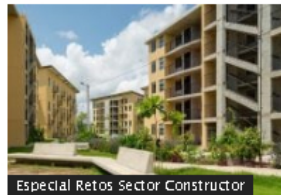
Especial Retos Sector Constructor

Grupo Abra de Avianca y GOL confirma acuerdo con Aerolíneas Argentinas