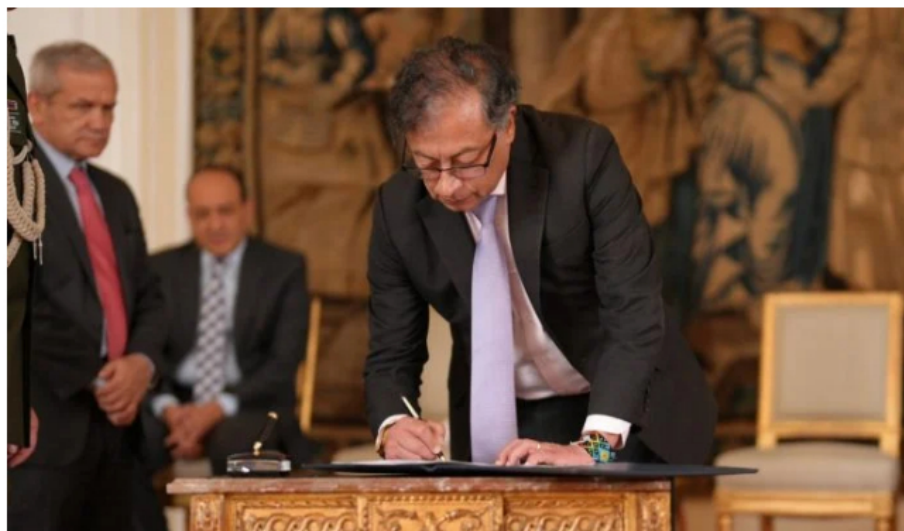
Presidente de Colombia Gustavo Petro.

El presupuesto del gobierno Petro para el 2024 fue aprobado este miércoles 18 de octubre por el Congreso de la República. La administración contará con un monto cercano a los $502,6 billones y se espera tenga foco en temas sociales y reformas a los sistemas de salud, pensión, educación, programas sociales, entre otros.