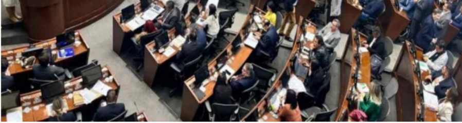
Gerente BanRep conclusiones sobre presupuesto general de la nación 2024. Foto: Senado de la República

conclusiones sobre presupuesto general de la nación 2024. Foto: Senado