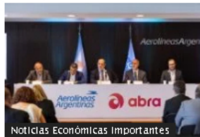
Noticias Económicas Importantes

Carbón de Colombia es menos competitivo en el mundo por reforma tributaria: Fenalcarbón