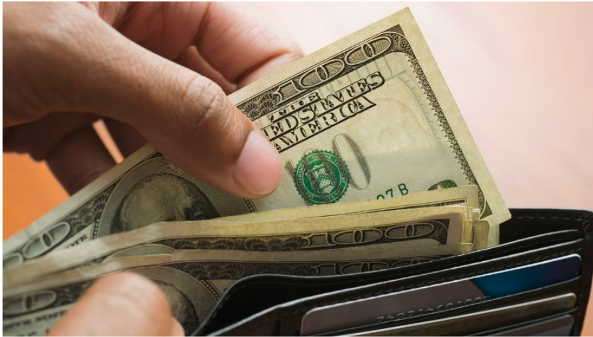
Así le fue al dólar en Colombia.