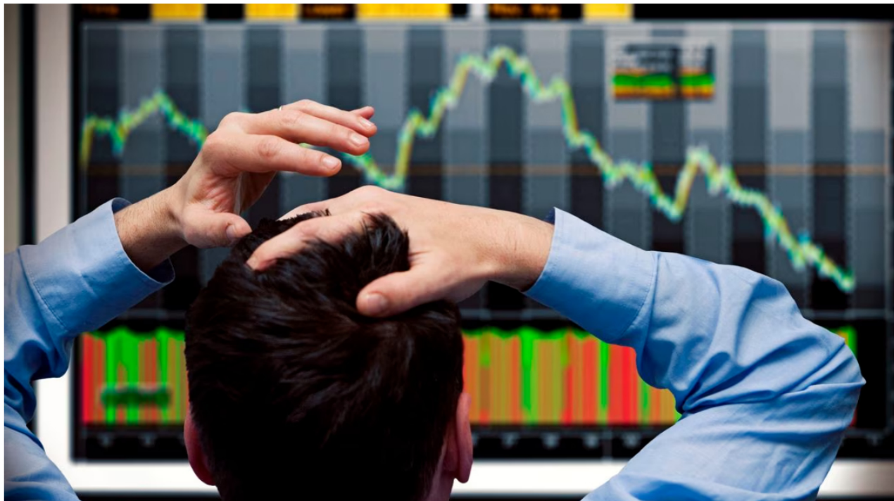
BVC y Ecopetrol acabaron con números rojos en la jornada del 19 de octubre.

Luego de casi una semana de buenos resultados, la Bolsa de Valores de Colombia volvió a tener un cierre negativo. Solamente un indicador se mantuvo en verde, y completa ya más de 5 días con variaciones positivas. Lógicamente, esto se sintió en varios de los títulos accionarios, como Ecopetrol , que también acabó con números rojos.