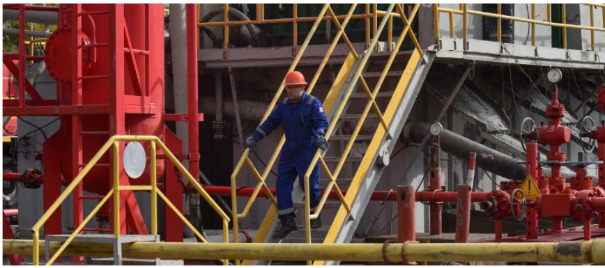
Empleados trabajan en un pozo de gas de la compañía energética estatal ucraniana Naftogaz, mientras continúa el ataque de Rusia contra Ucrania, en la región de Lviv