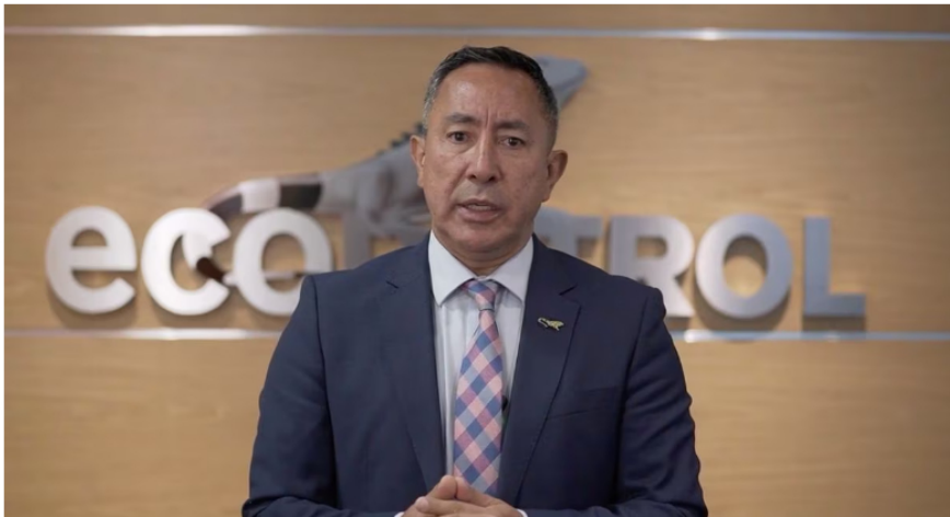
Ricardo Roa Barragán, presidente de Ecopetrol

La perforación de este pozo se dio entre el 16 de julio y el 10 de agosto de 2023 hasta una profundidad total de 14.057 pies (4.284 metros) y se determinó la presencia de gas natural en una nueva acumulación en el área de los bloques COL-5, Fuerte Sur y Purple Angel, donde se ubican los hallazgos de los pozos Kronos-1 (2015), Purple Angel-1 (2017) y Gorgon-2ST2 (2022).