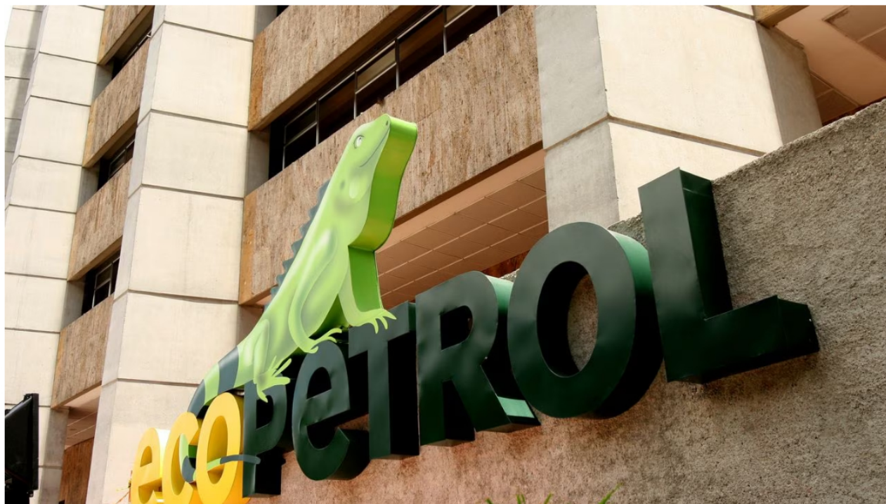
La participación de Ecopetrol es del 50 % y Shell es el operador del 50% restante.

Este jueves 19 de octubre, Ecopetrol confirmó el descubrimiento de nueva reserva de gas natural en el pozo exploratorio costa afuera Glaucus-1, el cual fue perforado en aguas profundas del Caribe colombiano, a 75 kilómetros de la costa y a más de 130 kilómetros del municipio de Coveñas, con una columna de agua de aproximadamente 2.340 metros.