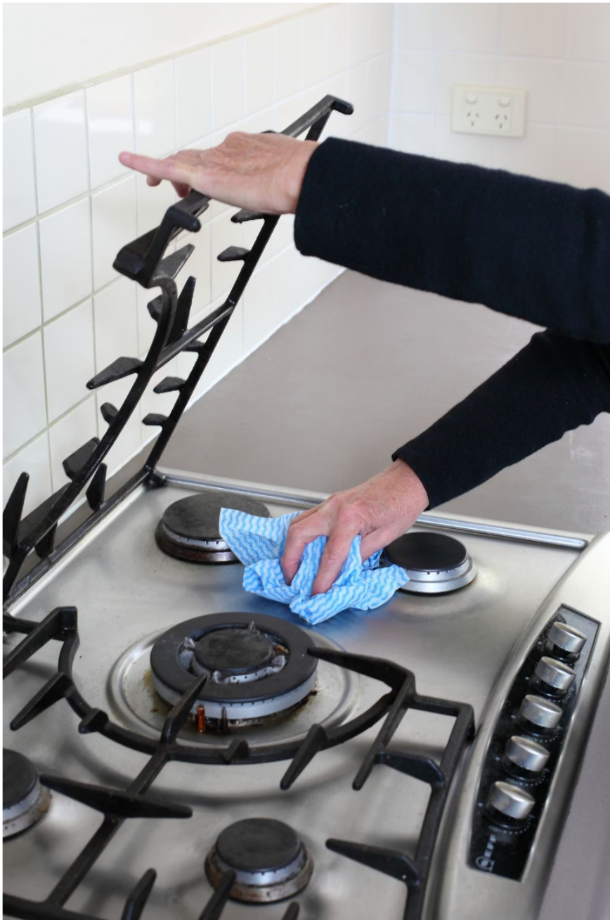
Canacol también anunció la cancelación del contrato de venta de gas a largo plazo "take or pay" que había suscrito con EPM (Empresas Públicas de Medellín). | Foto: Getty Images/iStockphoto

La compañía aseguró que esto se debió a "un patrón de obstáculos legales, sociales y de seguridad cada vez mayores que fueron surgiendo en los últimos meses". La empresa también aseguró que esta decisión fue tomada luego de un minucioso estudio, donde analizaron "las circunstancias legales, sociales y de seguridad; las dinámicas dentro del mercado de gas colombiano, y la decisión interna de invertir en sus programas de exploración de gas natural en la Cuenca del Valle Medio del Magdalena y en Bolivia".