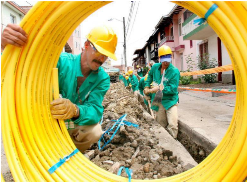
El gasoducto Jobo - Medellín quedó en el limbo porque Canacol se retiró.

La empresa canadiense incumple por segunda vez un contrato con EPM. La seguridad energética de Antioquia está en peligro.