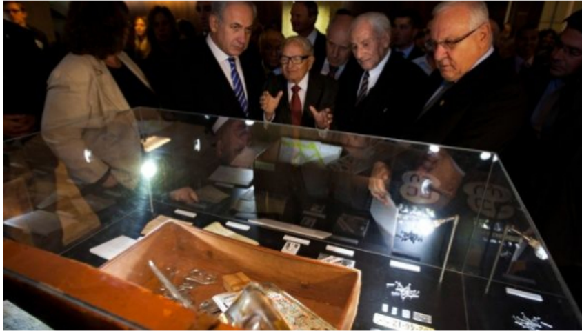
Eitan, en el centro, habla con Benjamin Netanyahu y otros líderes israelíes en una exhibición Knesset sobre su vida

del ministerio de Justicia israelí y se reunió con el inventor del software de vigilancia PROMIS. Después de una visita al Departamento de Justicia, Eitan obtuvo el software e hizo que un israelí que trabajaba en Silicon Valley instalara una "puerta trasera" (backdoor) en el programa. El agente del Mossad Robert Maxwell (padre de Ghislaine Maxwell, la notoria traficante sexual de niños y cómplice de Jeffrey Epstein) vendió la tecnología PROMIS a docenas de países de todo el mundo, incluida Colombia. Esto le dio a Israel acceso sin restricciones a la inteligencia que el programa recopiló en todos los países que lo usaban, amigos y enemigos por igual.