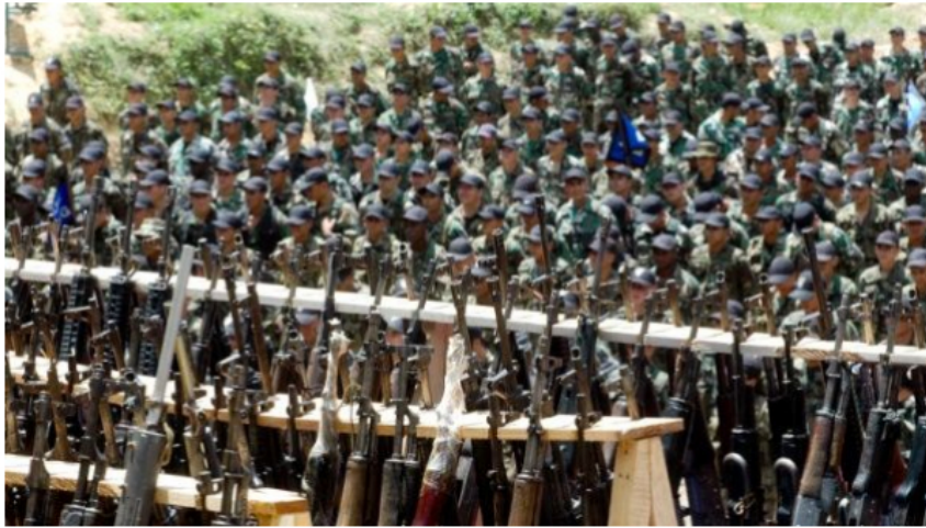
Miembros de las AUC entrenados por israelíes asisten a una ceremonia de desmovilización en Cristales, Colombia

Eventualmente Carlos Castaño fue asesinado, supuestamente por su hermano Vicente, otro poderoso líder paramilitar. Y, aunque las AUC se desmovilizaron oficialmente en 2007, los paramilitares pronto se reconfiguraron bajo diversas banderas y nuevas formaciones, manteniéndose estrechamente vinculados al Estado y los intereses empresariales.