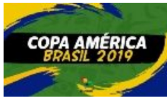
Copa América Brasil 2019