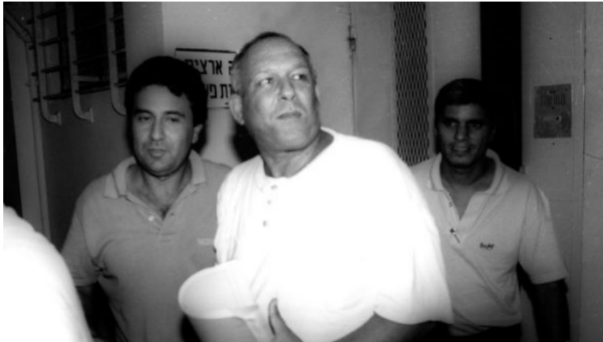
Yair Klein aparece en la corte israelí en 1989

Oficial militar retirado, Klein fundó una empresa de mercenarios llamada Hod Hahanit (Punta de lanza) en 1984, sacados de los grupos de ex policías israelíes y unidades de operaciones especiales.