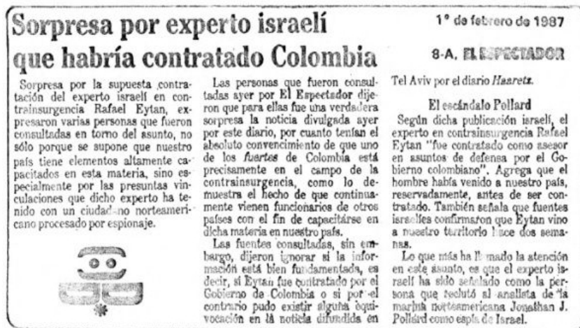
Un reporte Un informe ahora enterrado de la edición de febrero de 1987 de 'El Espectador' en español sobre la contratación de Eitan

Durante décadas, el papel de Eitan en el genocidio colombiano estuvo a la vista, incluso cuando su presencia pasó desapercibida para los medios de comunicación. La edición del 1° de febrero de 1987 del periódico colombiano El Espectador presentó un informe protegido sobre la contratación de Eitan, señalando que fue traído por su experiencia en "contrainsurgencia". En 1989, los periodistas veteranos Yossi Melman y Dan Raviv informaron en The Washington Post que el israelí había sido contratado como asesor de seguridad nacional del gobierno de Colombia.