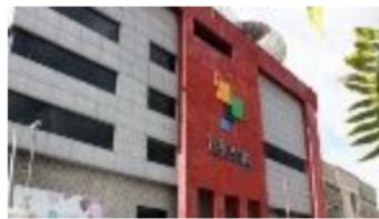
teleSUR, 14 aniversario