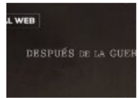
Después de la guerra