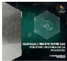
ste entre sus muertos: andemia