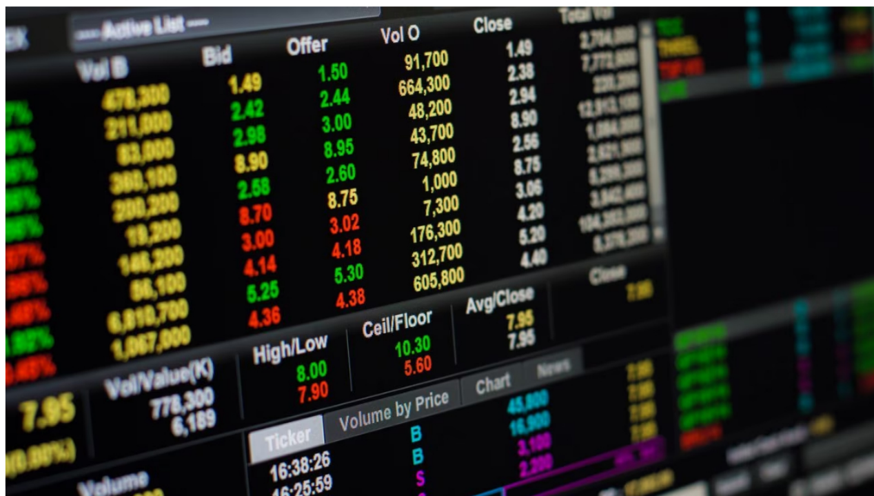
La Bolsa de Valores de Colombia amaneció en verde este miércoles.

Durante la mañana de este 18 de octubre, la Bolsa de Valores de Colombia y las acciones de algunas empresas reconocidas como Ecopetrol , registraron números en verde, luego de vivir jornadas dispares durante la semana pasada.