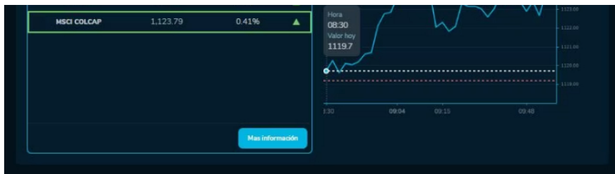
Así amanecieron los índices bursátiles de la BVC durante este 18 de Octubre

Empezó la limpieza en Atlético Nacional: estos jugadores se irían del equipo