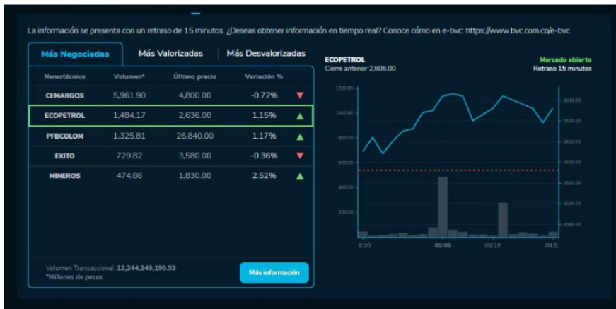
Así amanecieron las acciones de las empresas en la BVC durante este 18 de Octubre.

Respecto a las empresas que más ganan valor hoy en la Bolsa, la acción de Mineros es la que más repunta, con un crecimiento de 2,52% y un último precio por acción de 1.830.00. A esta le sigue ISA, con un crecimiento de 1,38% y un último precio de 14.700.00.