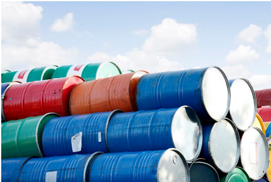
Los precios del petróleo se ubican en un terreno alcista este 18 de octubre.

Bancolombia cae cerca de 0,66% y tiene un último precio de 30.110.00. EXITO también está en el listado, con una caída del 0,36% y un último precio de 3.580.00.