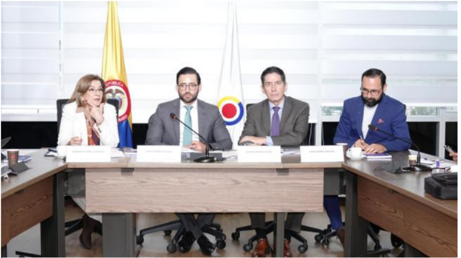
Ministro Andrés Camacho