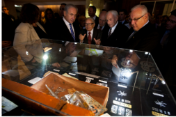
Eitan, en el centro, habla con Benjamin Netanyahu y otros líderes israelíes en una exhibición Knesset sobre su vida

Después de una visita al Departamento de Justicia, Eitan obtuvo el software e hizo que un israelí que trabajaba en Silicon Valley instalara una "puerta trasera" (backdoor) en el programa. El agente del Mossad Robert Maxwell (padre de Chislaine Maxwell, la notoria traficante sexual de niños y cómplice de Jeffrey Epstein) vendió la tecnología PROCOMS a docenas de países de todo el mundo, incluida Colombia. Esto le dio a Israel acceso sin restricciones a la inteligencia que el programa recopiló en todos los países que lo usaban, amigos y enemigos por igual.