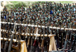
Miembros de lasAUC entrenados por israelíes asisten a una ceremonia de desmovilización en Cristales, Colombia

Pero la influencia de Israel en los escuadrones de la muerte de Colombia no se debe solo al entrenamiento de Klein. En su autobiografía, el fundador de las AUC, Carlos Castaño, escribió que había estudiado entre 1983 y 1984 en la Universidad Hebrea de Jerusalén y en escuelas militares israelíes. Castaño describió el entrenamiento en armamento y tácticas avanzadas que recibió y que se convertiría en la base de la guerra del paramilitarismo colombiano contra los agricultores.