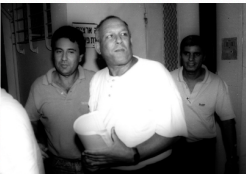
Yair Klein aparece en la corte israelí en 1989

Oficial militar retirado, Klein fundó una empresa de mercenarios llamada Hod Hahanit (Punta de lanza) en 1964, sacados de los grupos de ex policías israelíes y unidades de operaciones especiales.