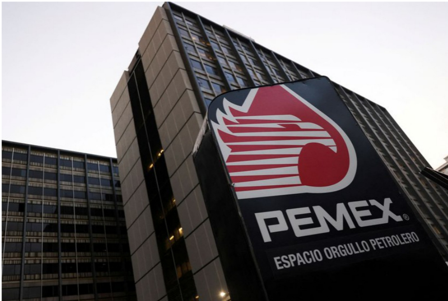
Logotipo de la petrolera estatal mexicana Pemex en su sede en Ciudad de México en 2022.

Los analistas se muestran escépticos ante la nueva estrategia de Pemex de construir campos petroleros en aguas someras y costa afuera en lugar de yacimientos en aguas profundas, que, aunque más complicados, son más factibles para incrementar las reservas agotadas.