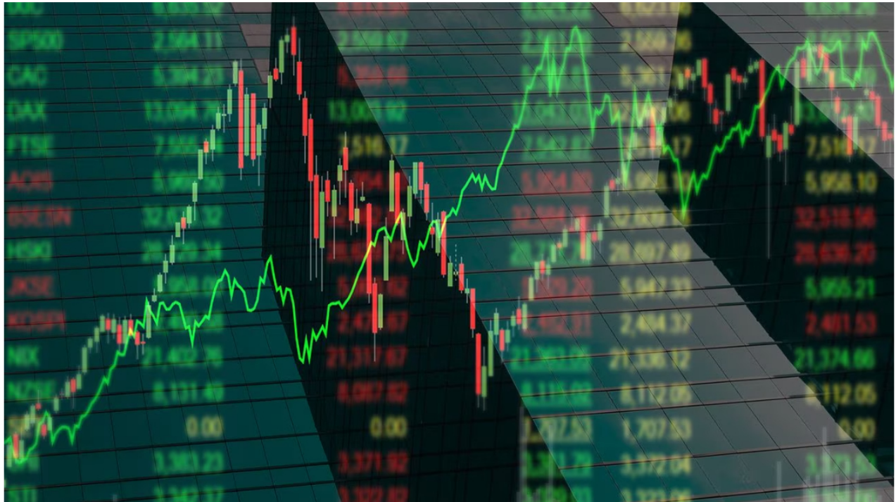
Segunda semana de octubre ha sido muy negativa en la Bolsa de Valores de Colombia.

Por tercera jornada consecutiva, la Bolsa de Valores de Colombia (BVC) acaba con números rojos, aunque un indicador sí logró cerrar negociaciones con números verdes. Ecopetrol mantiene su buen rendimiento, mientras que Nutresa vuelve a estar dentro de las más desvalorizadas. El dólar, luego del desplome de los últimos dos días, volvió a repuntar en el mercado bursátil.