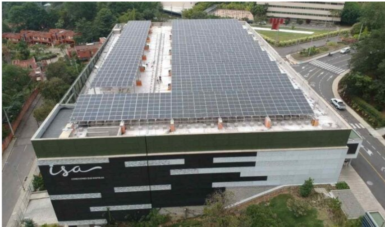
Interconexión Eléctrica (ISA) sería beneficiada con un artículo del Plan de Desarrollo, que cambiaría sus posibilidades de negocios.

Interconexión Eléctrica S.A. E.S.P. (ISA) informó que, a partir del primero de diciembre de 2023, se conformará en la compañía la Vicepresidencia de Riesgos y Cumplimiento , con el fin de continuar fortaleciendo los estándares internacionales y seguir siendo líderes de buenas prácticas corporativas.