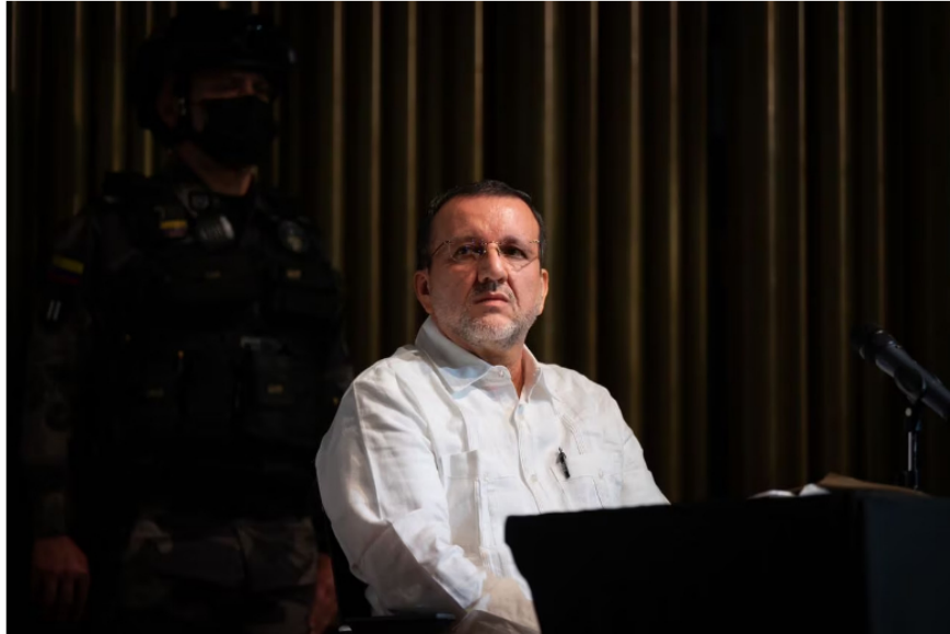
Alias Macaco fue invitado a Bogotá por la Cancillería.

De igual forma, reveló que junto a Salvatore Mancuso, excomandante paramilitar designado recientemente como gestor de paz, "iniciaré un proceso de aporte significativo sobre la ubicación de fosas comunes en la frontera con Venezuela y en mi caso particular, fosas ocupadas en la frontera con Ecuador, Putumayo y Vichada".