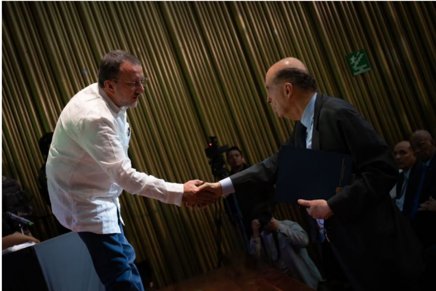
Canciller Álvaro Leyva y alias 'Macaco'.

"Cualquier intento por enlodarme con acusaciones infundadas , no tengo duda, responden al miedo frente a la verdad que quiero aportar ante la JEP", explicó el exjefe paramilitar al final de la carta. "En todos estos escenarios he probado mi convicción y actitud por buscar la paz y la reconciliación desde la verdad y al lado de la institucionalidad".