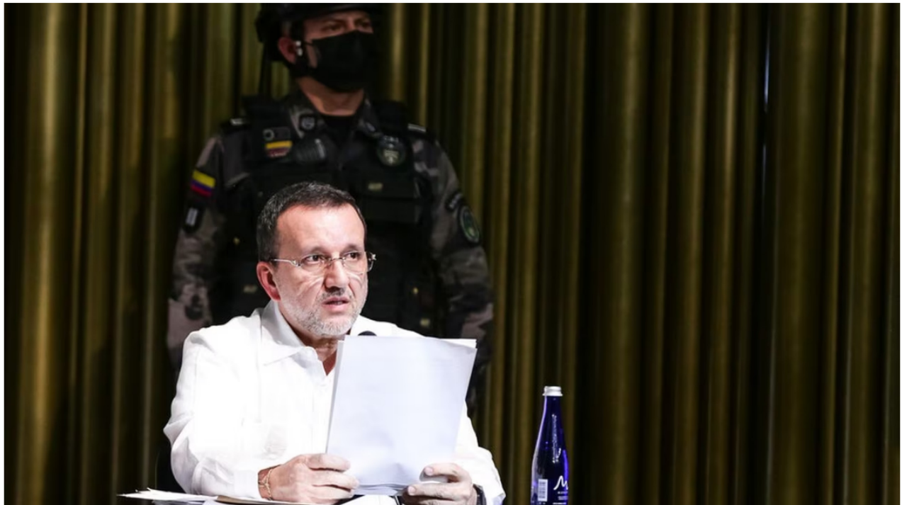
Carlos Mario Jiménez, alias Macaco, durante evento en el Centro de Memoria, Paz y Reconciliación.

En una carta de dos páginas, el excomandante paramilitar Carlos Mario Jiménez Naranjo, alias Macaco, negó tener cualquier vínculo con la banda criminal de La Cordillera, la cual ha sido vinculada recientemente con varios homicidios selectivos en el Eje Cafetero y con la planeación de un atentado contra el presidente Gustavo Petro Urrego.