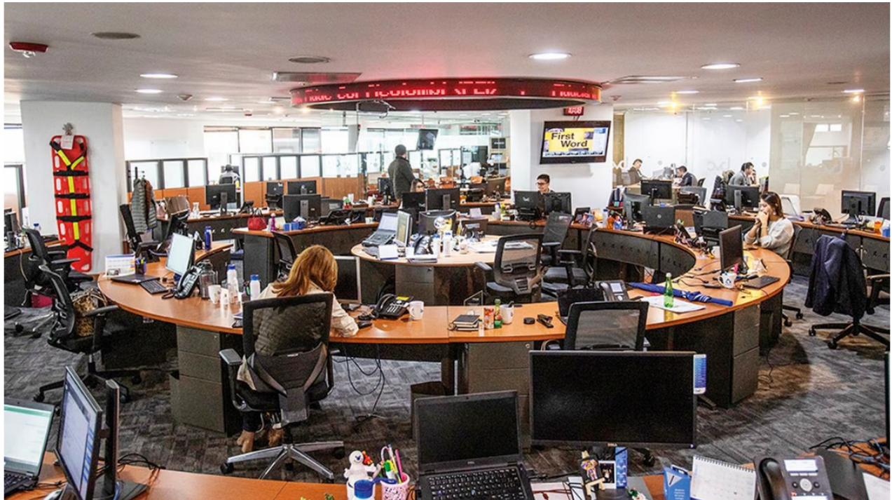
Así van las acciones en la Bolsa de Valores de Colombia este 11 de octubre.

Durante la jornada de este miércoles 11 de octubre, los mercados accionarios de Colombia amanecieron a la baja y con variaciones importantes para varias empresas o activos de la Bolsa.