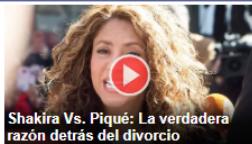
Shakira Vs. Piqué: La verdadera razón detrás del divorcio