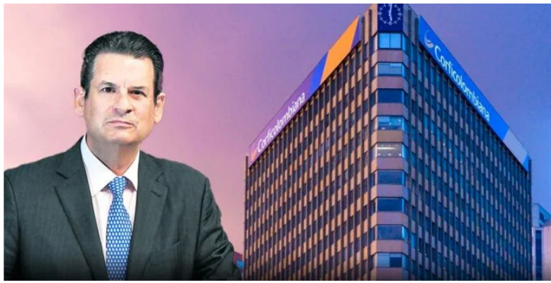
Luis Carlos Sarmiento Gutiérrez es el presidente de la junta directiva de Corficolombiana

Promigas representa el 42 % de las redes existentes y transportó el 46 % del gas natural del país, ya sea directamente o a través de sus subordinadas Transmetano (99,67%), Promioriente (73,27%) y Transoccidente (79%). El año pasado tuvo ventas en 2022 por $ 1.992.145 millones con una utilidad de $ 1.116.772 millones.