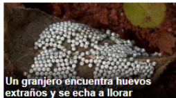
Un granjero encuentra huevos extraños y se echa a llorar