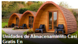
Unidades de Almacenamiento Casi Gratis En

Etiquetas: Alcanos de Colombia, Canacol, Cenit, Promigas