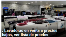
Lavadoras en venta a precios bajos, ver lista de precios