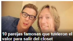
10 parejas famosas que tuvieron el valor para salir del closet