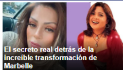
El secreto real detrás de la increíble transformación de Marbella