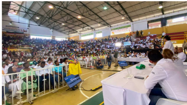
El presidente Petro recibió reclamos de la comunidad en Tumaco, Nariño.

Asimismo, otro ciudadano aprovechó y gritó en el fondo “;Cúmplale al pueblo ahora!”.