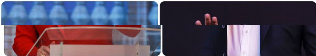
La senadora del Centro Democrático critica el Gobierno del presidente Gustavo Petro.

f Continúan las reacciones de los sectores políticos frente al inconformismo de las comunidades en cuanto al trabajo del gobierno de Gustavo Petro. La más reciente muestra la protagonizó una mujer, en medio de una nueva jornada del “Gobierno escucha” que se desarrollaba en Tumaco (Nariño).