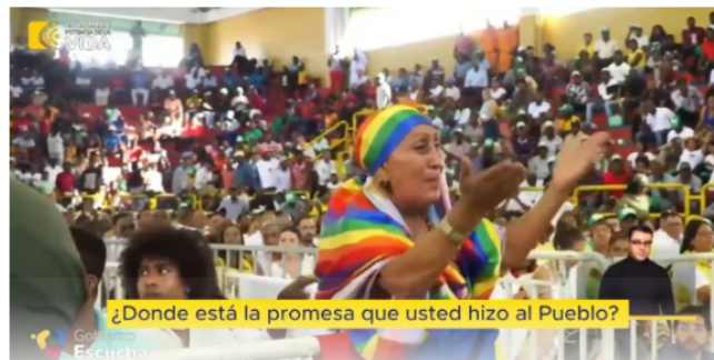
Dos ciudadanas le reclaman a Gustavo Petro en Tumaco, Nariño.

— María Fernanda Cabal (@MariaFdaCabal) October 11, 2023