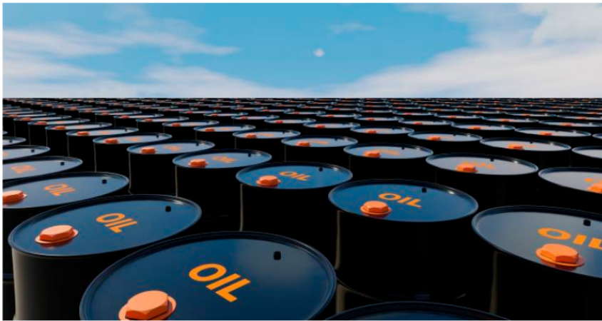
El Brent llegó ayer a los US$87,6 y acumula una alza de 3,6% frente al cierre previo a los ataques.

El barril de petróleo Brent cerró en US$87,6 y esa subida incidió de alguna manera en la caída de $154 que registró el dólar. La acción de Ecopetrol también subió.